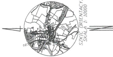
SZKIC ORIENTACYJNY SKALA 1: 10000